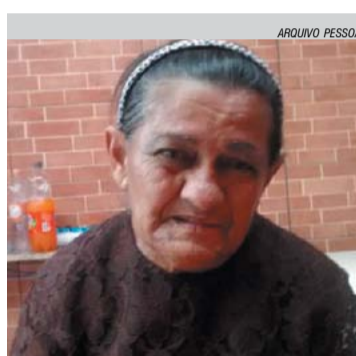
Mãe de companheiro na Mercedes está desaparecida